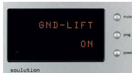
Mit Ground-Lift können eventuelle Erdschleifen getrennt und Brumm vermieden werden

anders, wenn der 530er die Zügel in der Hand hielt: Jedes Stück bekam einen individuellen Touch, feinste Dynamik – und Intonationsschwankungen des Sängers und Gitarristen MacLeod waren bestens zu spüren.