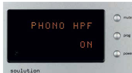
Bei Bedarf kann dem Phonoeingang ein Rumpelfilter zugeschaltet werden