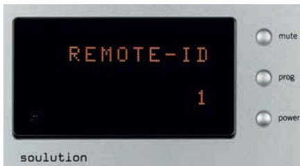
Auch über eine Anpassungsmöglichkeit für Fernbedienungen verfügt der Solution 530