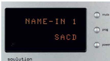
Jeder der fünf Eingänge lässt sich individuell benennen

Als Lautsprecher dienten die Audio Physic „Classic 30“ (Test ab Seite 20). In diesem Set-Up fiel sofort eine sehr großzügige Abbildung auf, getragen von einem recht stämmigen, aber absolut kontrollierten Tieftonfundament, das man der zierlichen Audio Physik niemals zugetraut hätte. Was kurz darauf ins Ohr stach, war die Selbstverständlichkeit, mit der feinste atmosphärische Unterschiede in Aufnahmen dargestellt wurden: Doug MacLeods überragend klingendes Reference-Recordings-Debut hatte ich zuvor schon einige Male im Auto und auch über kleinere Anlagen im Verlag gehört. So ab dem fünften Stück stellte sich aber immer eine leichte Lustlosigkeit ein, weil eine gewisse Eintönigkeit die Freude am Durchhören zunichte machte. Ganz